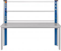
Table équipée d'une console d'alimentation, cadre de montage, cadre mobile pour le groupe frigo

Ce poste de travail/laboratoire permet le montage d'un banc d'essai complet en combinaison avec l'unité de base ET 910 et les kits de complément ET 910.10 et ET 910.11 ainsi que le kit d'accessoires ET 910.12.