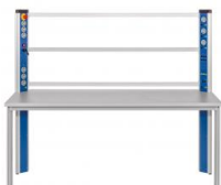
Table équipée d'une console d'alimentation, cadre de montage, cadre mobile pour le groupe frigo

Ce poste de travail/laboratoire permet le montage d'un banc d'essai complet en combinaison avec l'unité de base ET 910 et les kits de complément ET 910.10 et ET 910.11 ainsi que le kit d'accessoires ET 910.12.