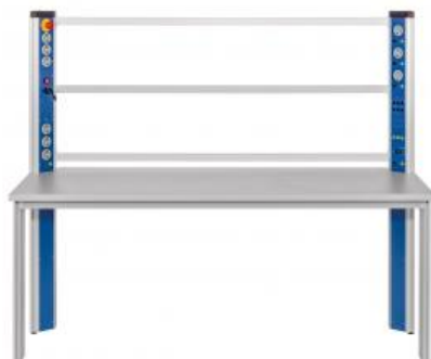
Table équipée d'une console d'alimentation, cadre de montage, cadre mobile pour le groupe frigo

Ce poste de travail/laboratoire permet le montage d'un banc d'essai complet en combinaison avec l'unité de base ET 910 et les kits de complément ET 910.10 et ET 910.11 ainsi que le kit d'accessoires ET 910.12. Le poste de travail/laboratoire se compose d'une table équipée d'une barrette d'alimentation, un bâti pour la réception des composants, un conteneur à roues et un cadre mobile pour le groupe frigorifique.